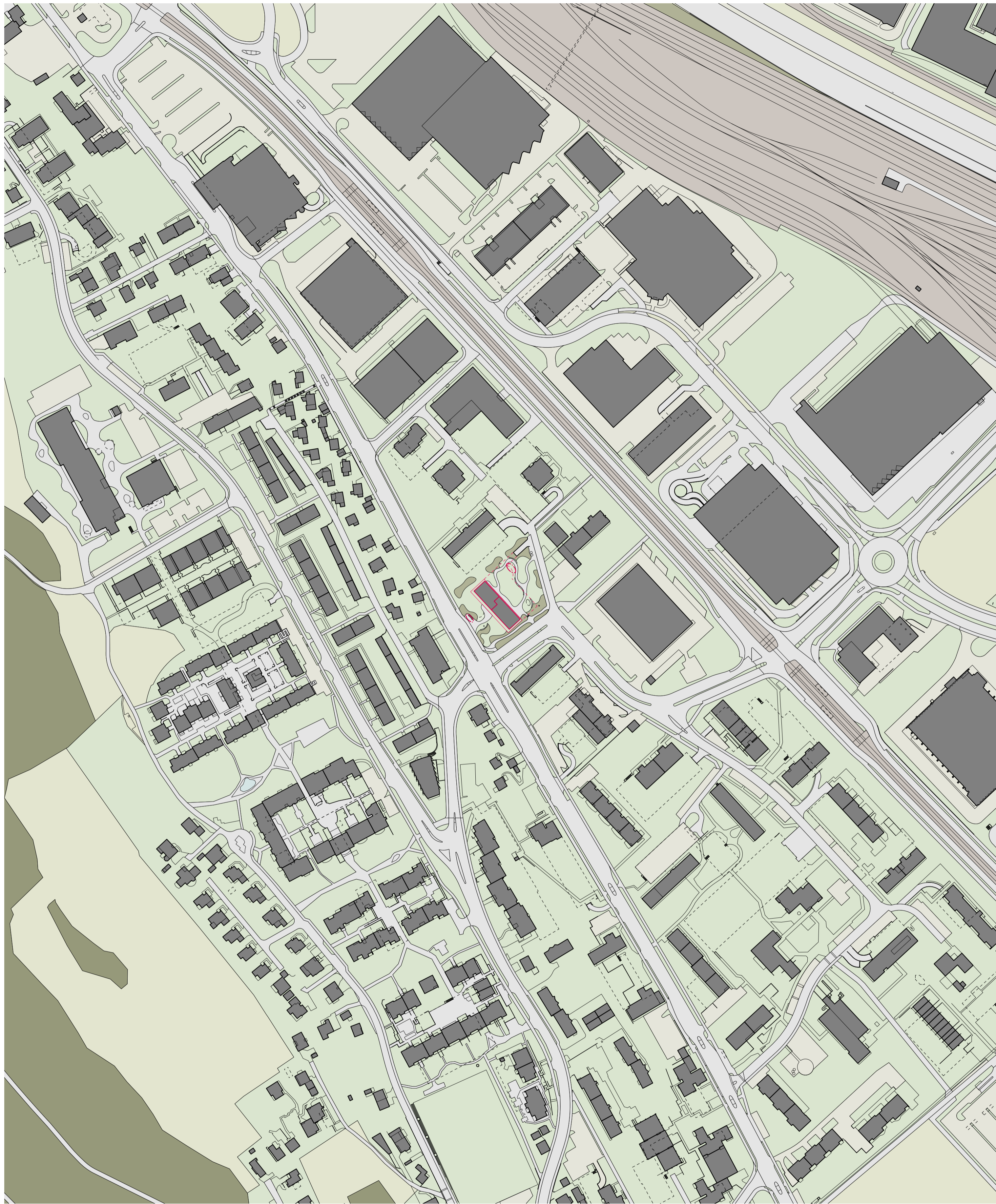
#000103 Situation 1/2000

MAIER HESS Alexander Hess 33-Baugesuch 000103 Bauherrschaft: Varioserv AG, Sonnentalsstrasse 19, 8600 Dübendorf Eigentümerschaft: ALGO Real Estate AG, Schönblickstrasse 3, 8045 Meggen Architekt: Maier Hess Architekten GmbH, Neptunstr. 25, 8032 Zürich, mail@maierhess.ch, 044 383 5005 Erstanzneubau Bahnhofstrasse 96/98, 8957 Spreitenbach file-date-time: spb-241105-1000 Format: A1q Nullkote: +0.00/-400.00 50 m